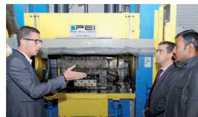
Mise au point d'un outillage pour la filiale indienne d'un groupe industriel international.

8, chemin des Carrières - 38840 La Sône Tél. : 04 76 64 41 75 - contact@reffay-sas.fr www.reffay-sas.fr