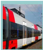
Ferroviaire Chambre de coupure Disjoncteurs

L'expérience de ses équipes et la performance de son parc machines répondent aux volontés d'une clientèle issue de secteurs exigeants et performants :