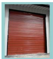
Bâtiment Pièces de structure pour portes industriels Equipement pour chantiers