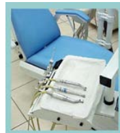
Dentaire Table pour instruments