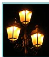
Eclairage Capots Pièces techniques