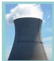
Electrique Coffret électrique Sectionneurs